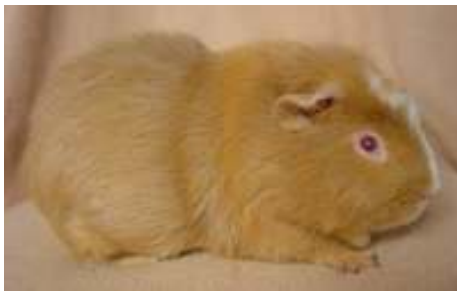
En ruhåret Skinnybærer

En Skinnybærer er i bund og grund bare et behåret marsvin, der bærer på genet til at lave skinnyunger. Af udseende ligner den alle andre behårede marsvin, dog bør de være ru i pelsen. De kommer i mange farver og afskygninger, lige fra de glatte korthårede, semilanghårede til de ru der ligner skurebørster.