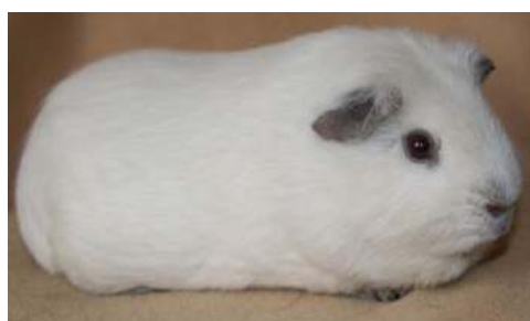
En glathåret Skinnybærer